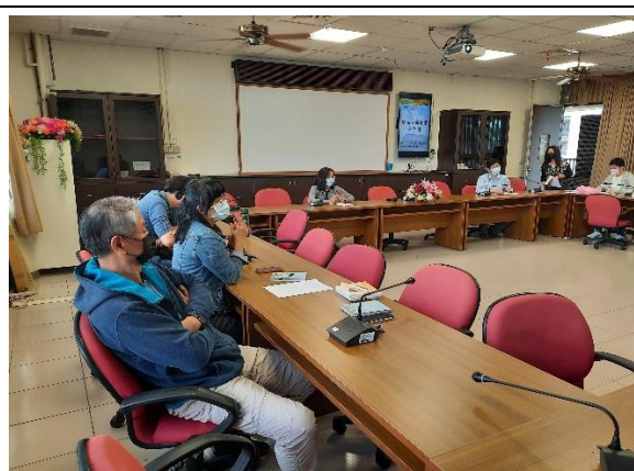
照片說明：教師間交流