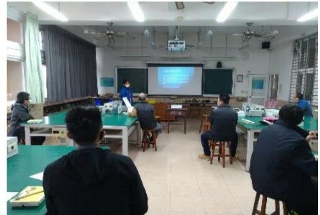
照片說明：開關電源返馳式轉換器電路架構說明