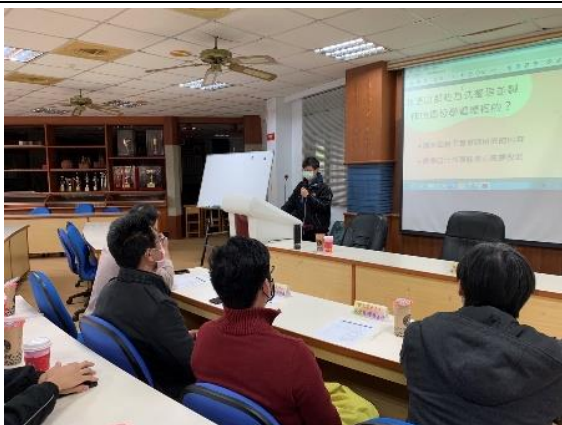
照片說明：學生進行課程學習分享