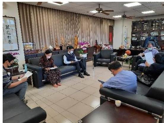
照片說明：跨校多元課程討論