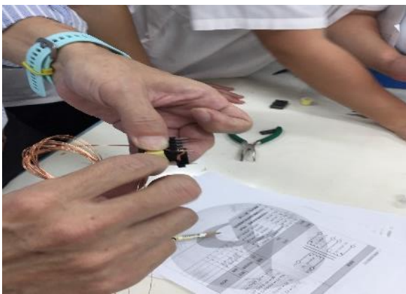
照片說明：學員自己實際動手操作