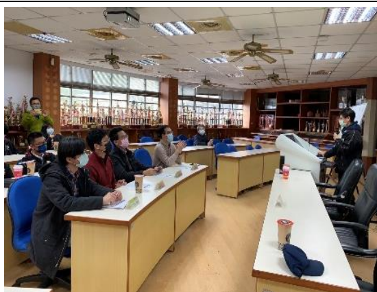
照片說明：學生進行課程學習分享