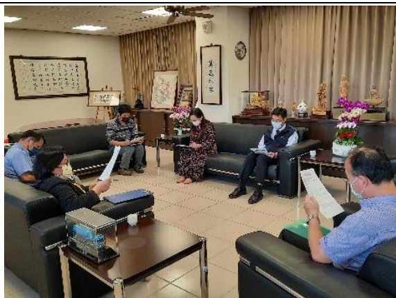
照片說明：跨校多元課程討論