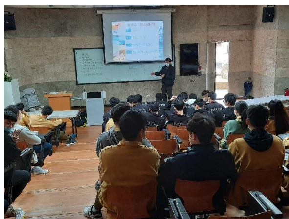
照片說明：羅工_數位邏輯