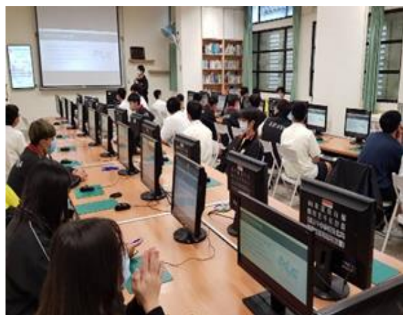
照片說明：學員專心聆聽