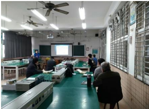
照片說明：講師與老師說明研習內容