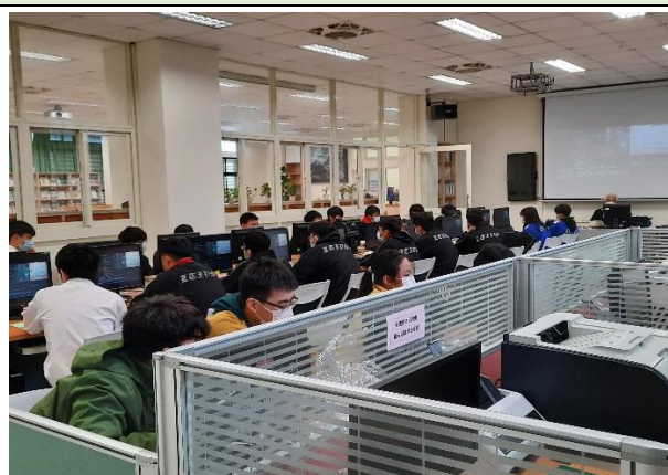
照片說明：羅工_無人機應用技術