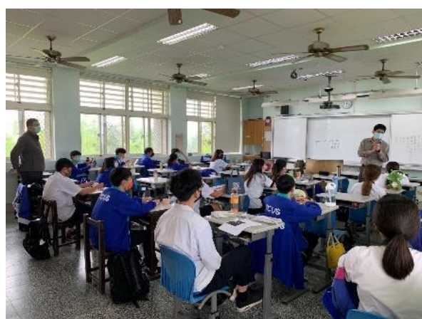
照片說明：羅商_生活財經