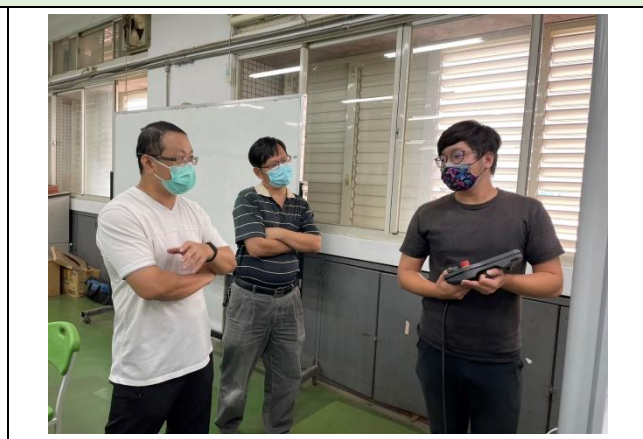
照片說明：機械手臂教導器操作說明