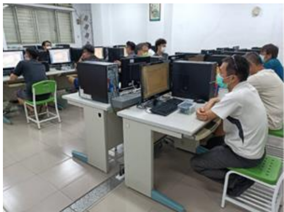
照片說明：學員仔細聆聽