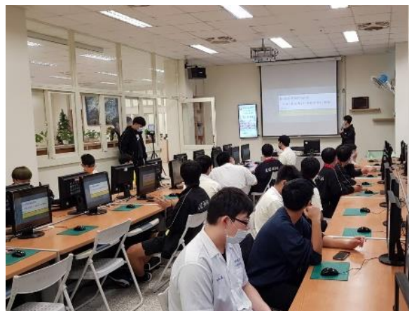
照片說明：李○丞同學分享