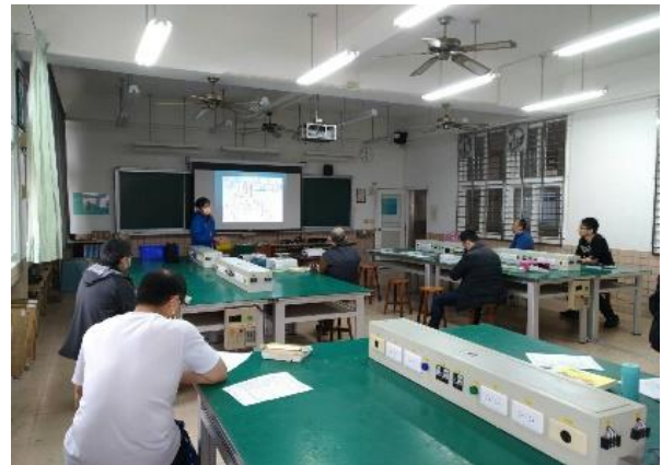
照片說明：學員聆聽研習並記錄重點