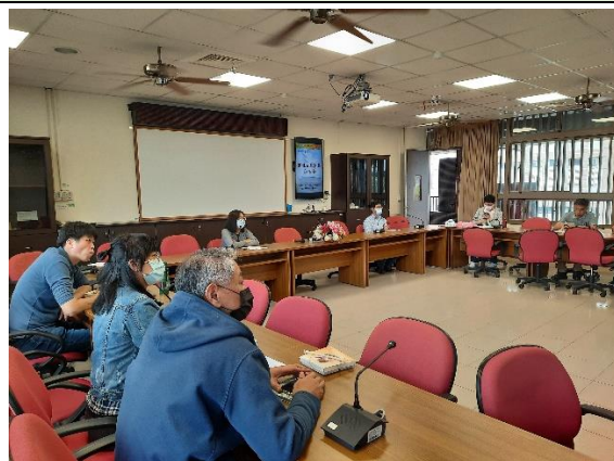
照片說明：實施經驗分享