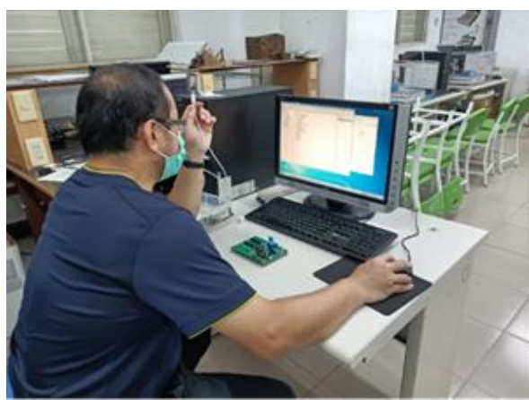
照片說明：講師說明硬體連線方式