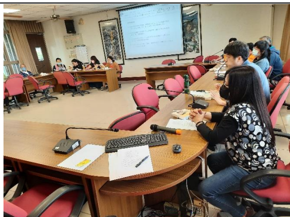
照片說明：教師間交流