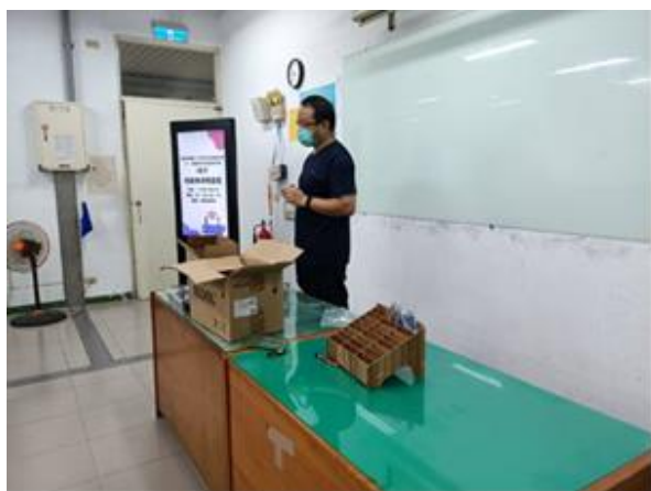
照片說明：講師開場與活動海報