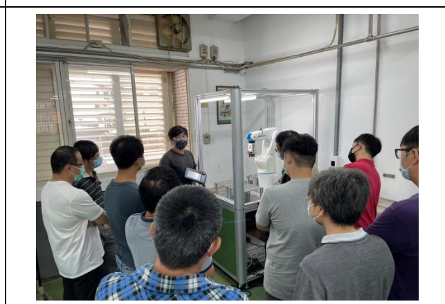
照片說明：機械手臂定位操作