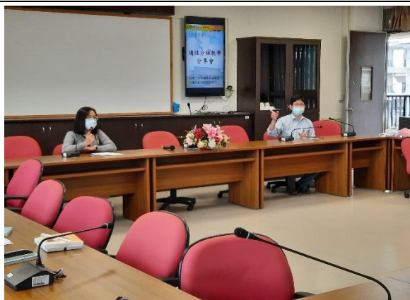
照片說明：實施經驗分享