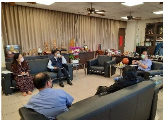
照片說明：跨校多元課程討論