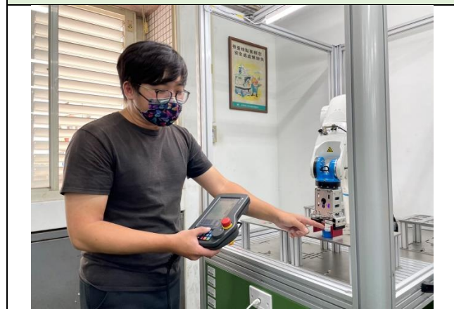
照片說明：機械手臂操作說明