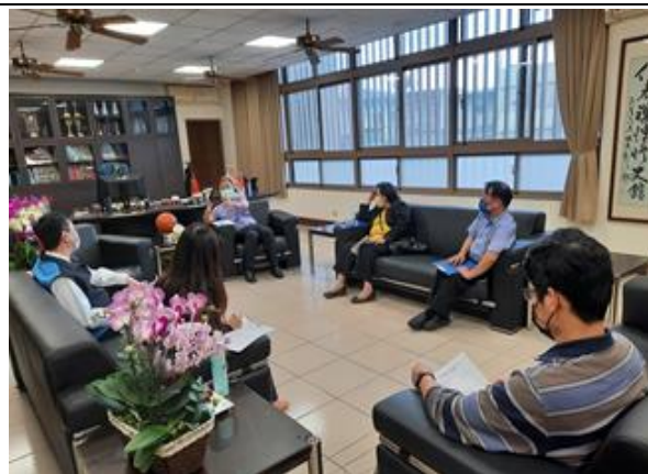
照片說明：跨校多元課程討論