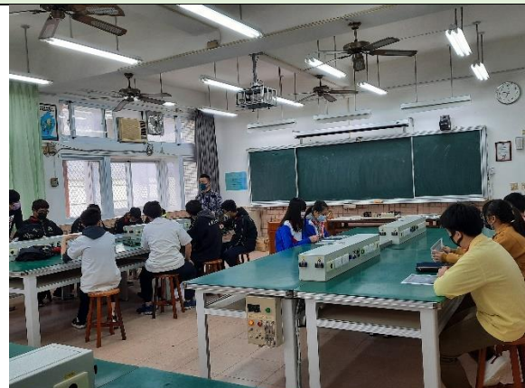
照片說明：羅工_電機專業實習