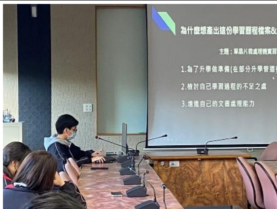
照片說明：學生進行課程學習成果分享