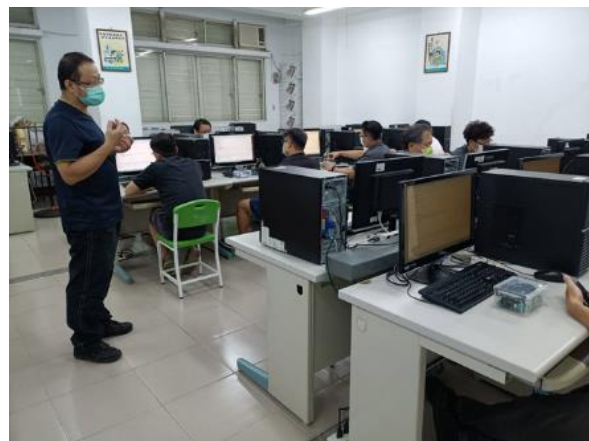
照片說明：講師與學員 Q&A