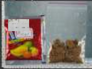
毒品：Ethylone + CMC