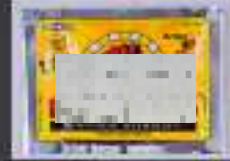
毒品：Mephedrone + Methylone