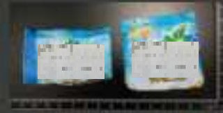
毒品：Mephedrone + Nimetazepam + Methylone