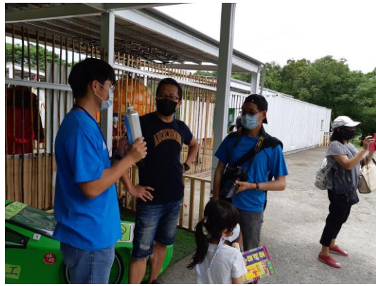
學生介紹氫氣瓶安全性