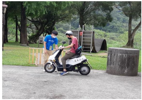
氫能源機車民眾體驗試乘