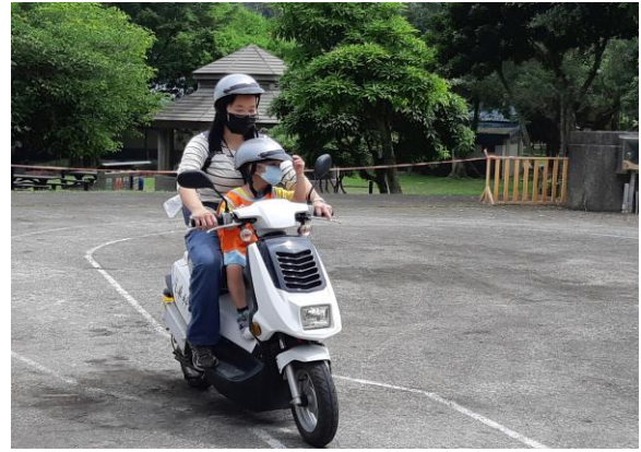
氫能源機車民眾體驗試乘