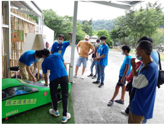
氫能源車操作示範